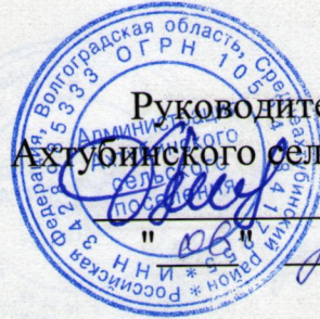
ГРАФИК дежурств по УКП при администрации Ахтубинского сельского поселения